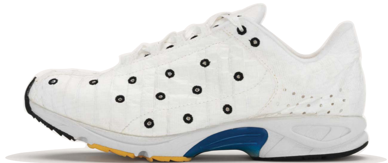
Esemplare di FedEx, 2001

... così decidemmo di avvolgere le buste FedEx attorno alla base di una scarpa