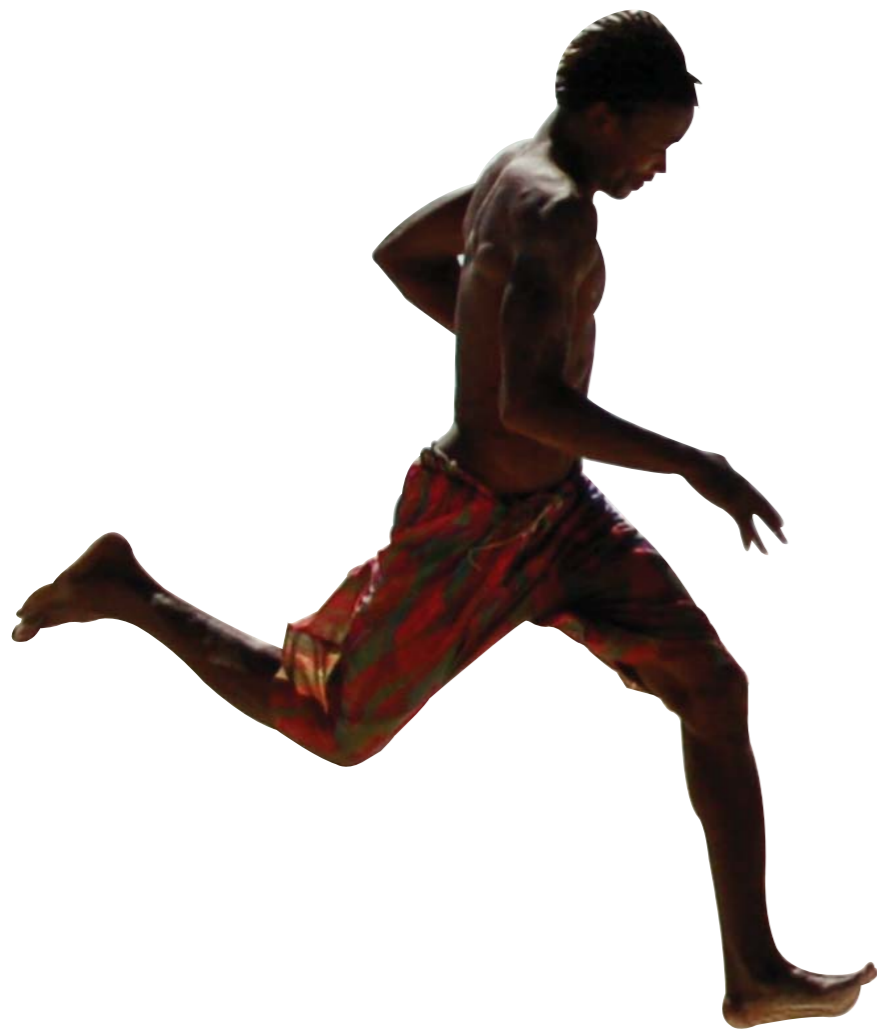
Corsa a piedi nudi

e se andare a piedi nudi rafforzasse i piedi?