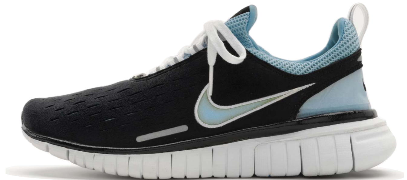
Nike free, 2004

... e se si rinforzassero anche le ginocchia e le anche?