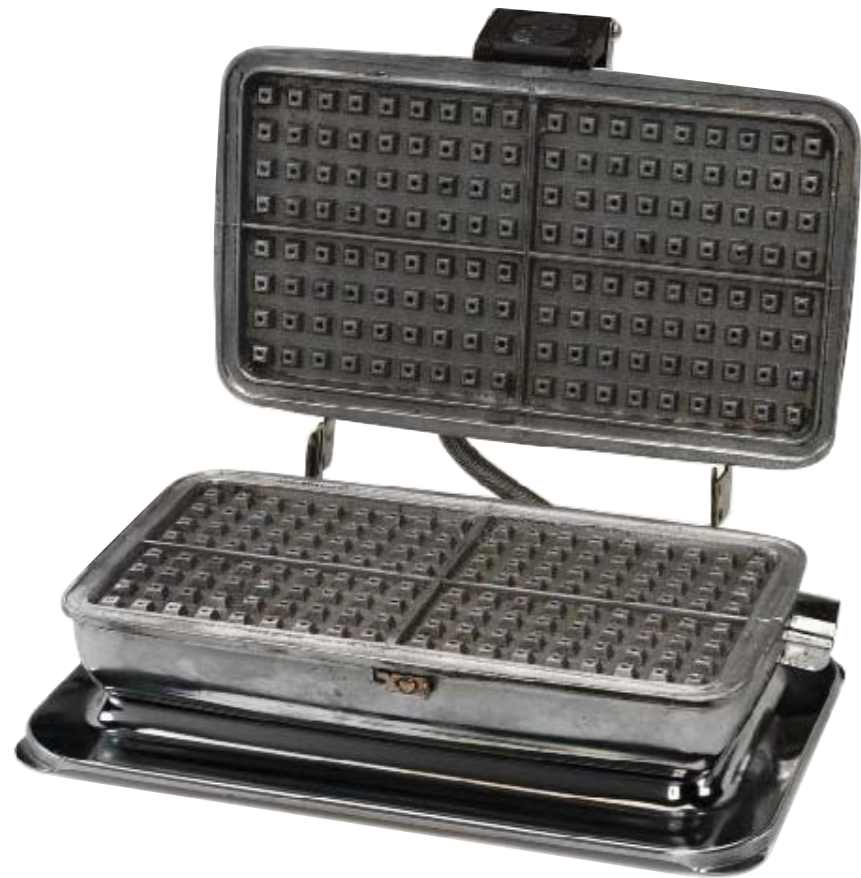
Piastra per waffle, 1970