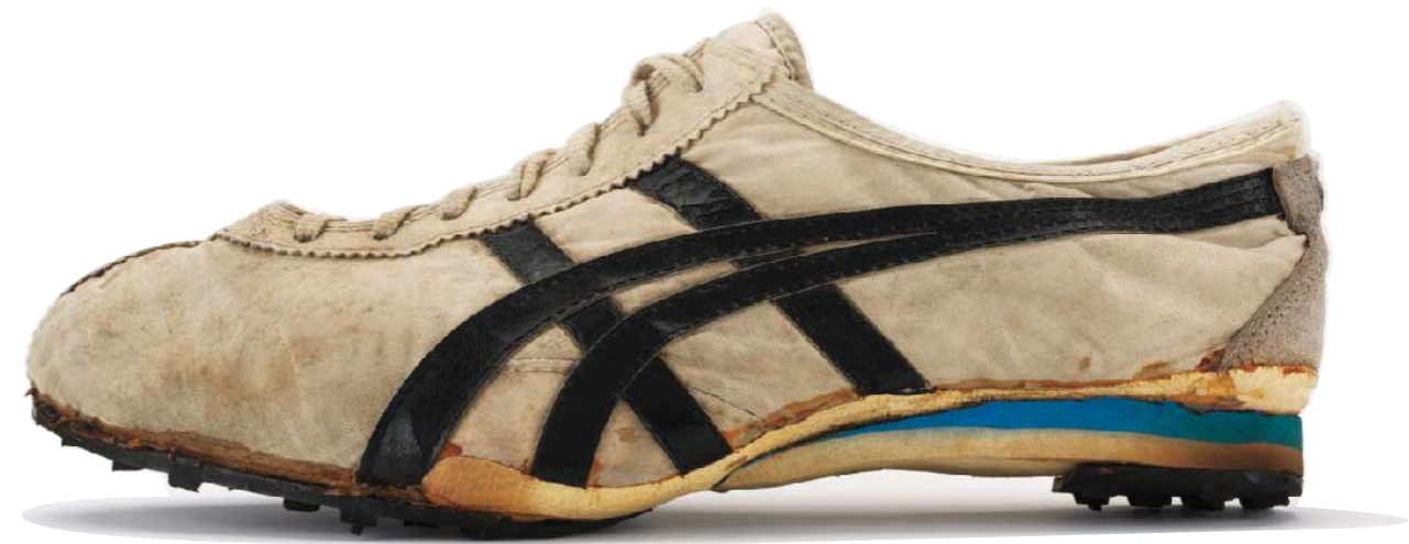
Tiger con suola waffle, 1971

... sembrava di avere dei cuscini sotto ai piedi