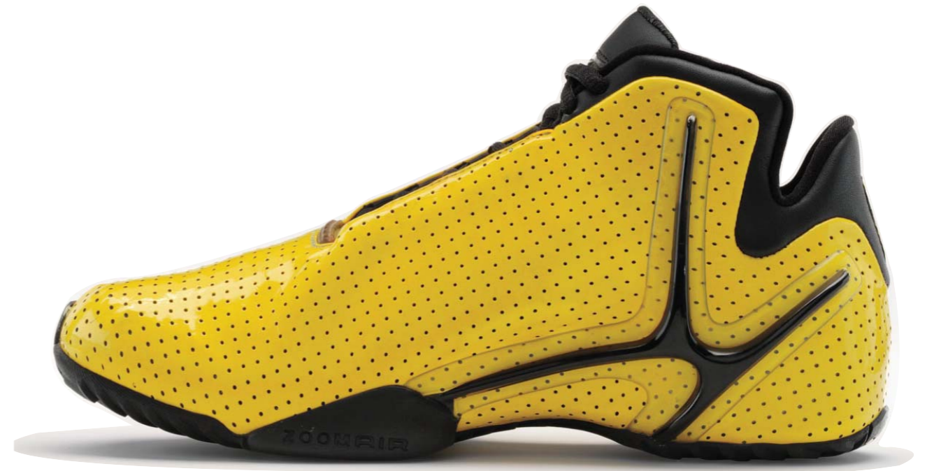
Telaio laterale, 2001

... il risultato fu una delle scarpe da basket più leggere mai realizzate